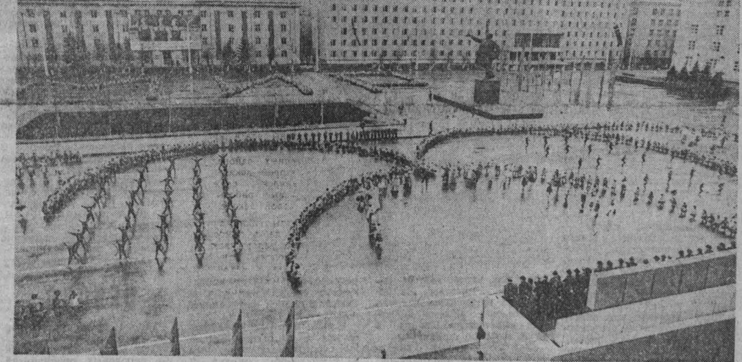
НА СНИМКАХ: праздничная демонстрация в Кемерове.

Вслед за будущими воинами на площадь Советов вступает колонна победителей предмайского соревнования. Эти люди — золотой фонд города. Их труд отмечен орденами и медалями. Они несут знамена союзных республик. Страна отметила 60-летие образования СССР. В тесном единстве живут и работают советские люди. И сегодня в колоннах демонстрантов идут трудящиеся многих национальностей, представители разных народностей страны, которых объединяют один и те же цели. В головной колонне