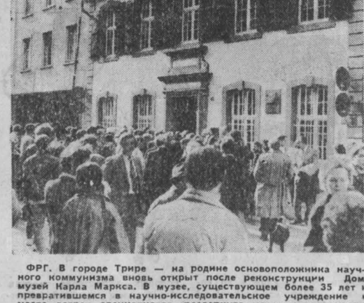
ФРГ. В городе Трире — на родине основоположника научного коммунизма вновь открыт после реконструкции Дом-музей Карла Маркса.

МАНАГУА, 1. (ТАСС). Революционное правительство Никарагуа твердо следует курсом прогрессивных преобразований в интересах народных масс, несмотря на эскалацию вооруженной агрессии, организованной Соединенными Штатами.