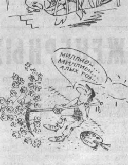
Рис. В. Илюндеева.

Вызывают неудовольствие сборы денег на подарки для коллег по работе. Но внимание к коллеге в день рождения можно выразить не обязательно так. Достаточно украсить в этот день его рабочий стол букетом цветов и поздравительной открыткой с подписями всех сослуживцев.