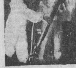
НА СНИМКЕ: идет подготовка к посевной.

Среди фундаментальных тем института — создание атомных электростанций нового типа.