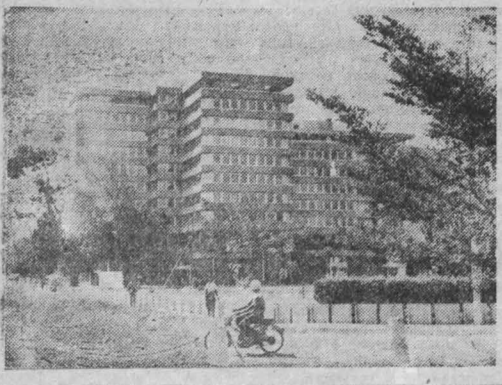
НА СНИМКАХ: монумент Независимости в Ломе—столице страны; современные административные здания в столице.