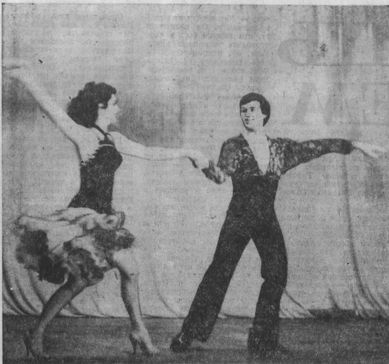
ДВА дня в рабочем поселке Яшино проходила областная смотр-конкурс балльных танцев сельских учреждений культуры. В нем участвовали свыше 120 человек. Наиболее интересные программы представили коллективы р. п. Яшино, Крайнего и Кемеровского районов. Особенно ярко выступил ансамбль «Современник» (Кемеровский район). Ф. Ф. Фоминского.

Е. РЯПСОВА, педагог-организатор клуба «Орленок», г. Кемерово.