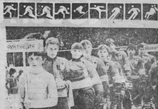
НА ПРИЗ КЛУБА «ЗОЛОТАЯ ШАЙБА»

Зашкал А. АНТОНОВ, корр. «Кузбасса», г. Новокузнецк.