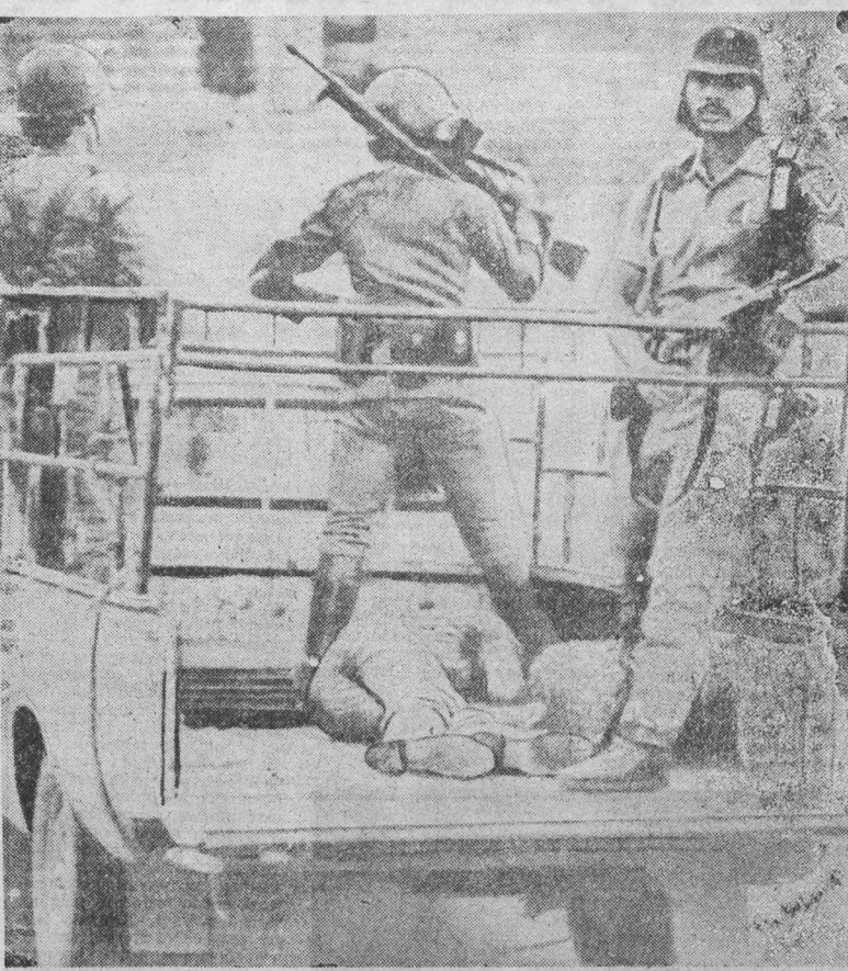
ЧУДОВИЩНЫЕ репрессии обрушивает салавадорский хунта на население страны, пытается потопить в крови освободительную борьбу народа. Обсыпая, расправы над патриотами стали обычной практикой военной диктатуры, опирающейся на щедрую поддержку Вашингтона. Стремлясь любой ценой сохранить салавадорский режим, США поставляют ему вооружение, обучают в своих лагерях тысячи солдат хунты. НА СНИМКЕ: наркотики увозит своя беззащитные жертвы.

В эти дни на страницах итальянской печати, как, впрочем, и печати других стран Западной Европы, то и дело появляются статьи, посвященные «Общему рынку». В конце марта Европейское экономическое сообщество отмечает двадцатилетие своего существования. Четверть века назад шесть стран Западной Европы — ФРГ, Франция, Италия, Бельгия, Голландия и Люксембург — подписали так называемый Римский договор, положивший начало процессу многосторонней государственной монополистической интеграции. Среди основных целей этого союза можно назвать такие, как укрепление классовой «позиции монополистической буржуазии внутри сообщества», совместная борьба против как национальной, так и международного рабочего движения, поддержка мичподлий и их конкурентной борьбе на мировом рынке. Позднее «Общий рынок» расширился до «десятки». В 1973 году к нему присоединились Дания и Ирландия. В 1981 году членом ЕЭС стала Греция. Сейчас ведутся