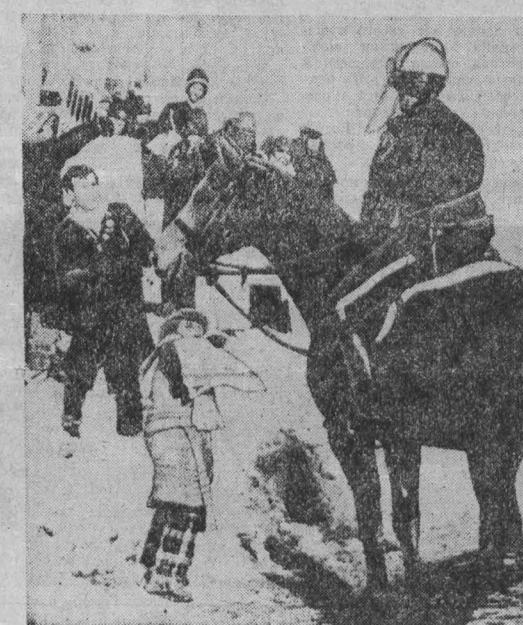
АРЕСТЫ и полицейские расправы — таков ответ властей Соединенных Штатов на массовые выступления американской общественности против милитаристского курса администрации Рейгана.

Крестьяне северной Суматры (Индонезия) испокон веков жили в мире и дружбе с обитателями в джунглях слонами. Но в последние годы слоны все чаще стали проявлять агрессивность. Они вытесняют посевы риса, кукурузы, разрушают дома жителей деревень. Недавно 25 слонов в боевом строю предприняли наступление на одну из деревень на севере страны. Крестьяне считают, что гнев слонов и стремление мстить человеку объясняется вторжением людей в джунгли, рубкой леса в местах их обитания.