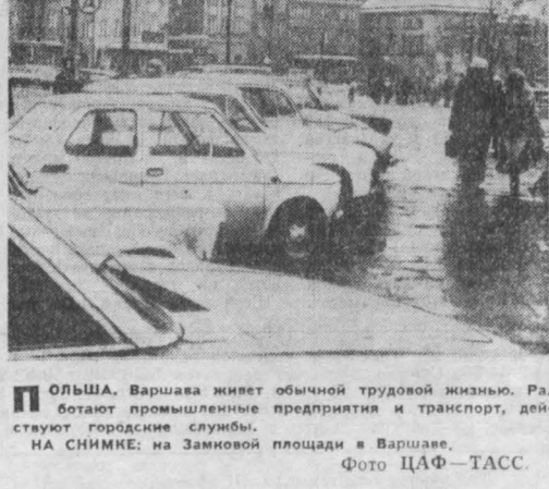
Польша, Варшава живет обычной трудовой жизнью. Работники предприятий и транспорт, движущийся по площадям в Варшаве.

Большая группа японских писателей, выступающих за прекращение гонимы вооружений и ликвидацию ядерного оружия, направляет обращение Председателю Президиума Верховного Совета СССР Л. И. Брежневу и президенту США Р. Рейгану. В настоящее время, говоря в этом обращении, в мире накоплено столько ядерного оружия, что его хватало бы для многократного уничтожения всей жизни на земле. Параллельно с разработкой нейтроновой бомбы, новых типов ракет, крылатых ракет и т. п. открыто выражается ужасная мысль о возможности ядерной войны. Мы — провинники подобыных идей и действий. Нельзя вести ограниченный войну с помощью ядерного ору-