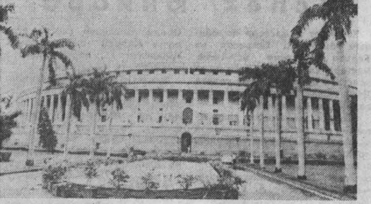
НА СНИМКЕ: здание индийского парламента.