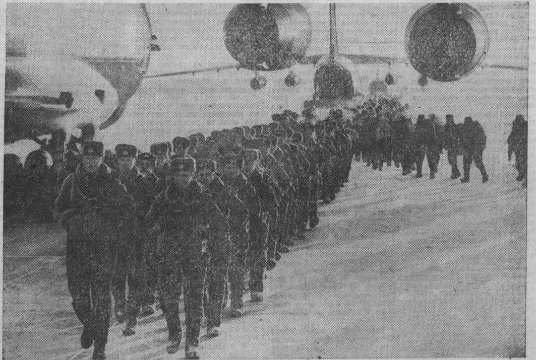
НА СНИМКЕ: воины-десантники.

Рабоче-крестьянская Красная Армия со дня своего рождения стояла на страже завоеваний Октября, свято выполняя наказ В. И. Ленина: «Всякая революция лишь тогда что-нибудь стоит, если она умеет защищаться». Закаленная в горниле гражданской войны, в сражениях с немецко-фашистскими подданными в годы Великой Отечественной войны, Красная Армия навеки покрыла себя неуязвимой славой. Советский воин для