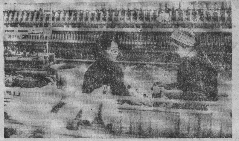
МНР. Улан-Баторское производственное объединение шерстоперерабатывающих предприятий — лидер в трудовом соперничестве коллективов этой отрасли. За успехи в социалистическом соревновании объединение было награждено недавно орденом «Полярной Звезды». Здесь четко налажены все технологические процессы, аффективно ведется обучение молодых специалистов.