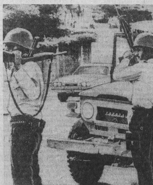
АДМИНИСТРАЦИЯ Рейгана всячески поощряет безжалостные истребления противников нынешнего режима в Сальвадоре.

ЛОНДОН, 11. (ТАСС). «Объявленная Рейганом программа массового производства боевых отравляющих веществ и измерение администрации США выделить на эти цели 810 миллионов долларов в 1983 финансовом году».