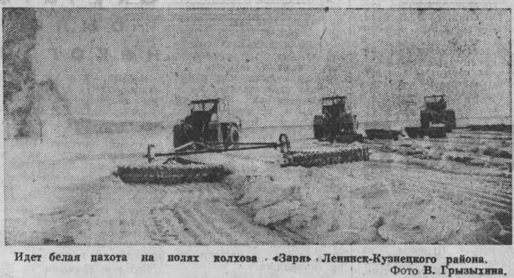
Идет белая пахота на полях колхоза «Заря» Ленинск-Кузнецкого района.