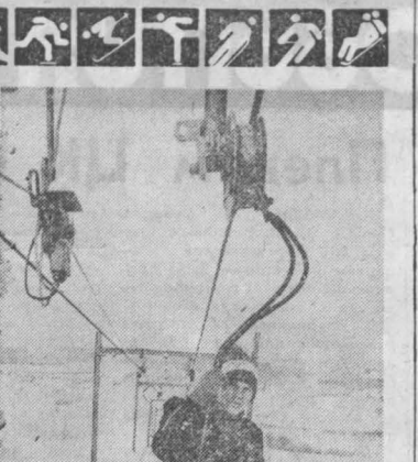
НА СНИМКАХ: домик; опробование подъёмника.

Этот подарок любителям лыжного спорта поселка готовят рабочие шахты «Алардинская».