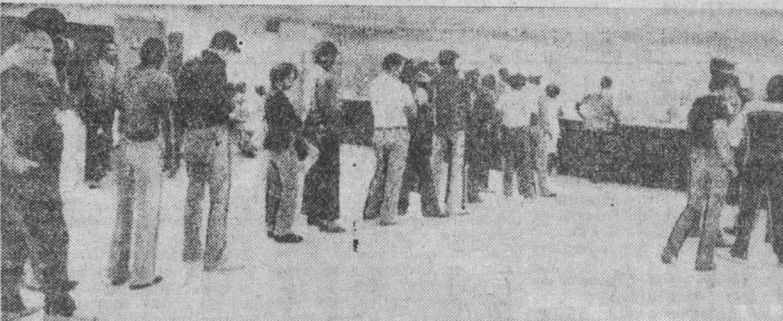
Очередь на биржах труда — типичная картина для многих городов США (на снимке). В условиях переживаемых странами экономическим трудностей 9 миллионов американцев лишены одного из основных прав человека — права на труд.

Выступая помощником госсекретаря изобливалось грубыми выпадами в адрес Советского Союза, Кубы и других социалистических стран, а также Никарагуа, попытками голословно обвинить их в «военной поддержке» сальвадорских повстанцев. Эти вымыслы понадобились представителю госдепартамента, чтобы «обосновать» призывы к «решительным действиям», направленным на расширение военной поддержки реакционных проамериканских режимов в Центральной Америке.