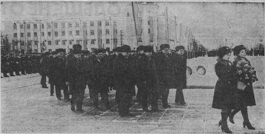
ВОЗЛОЖЕНИЕ ВЕНКОВ К ПАМЯТНИКУ В. И. ЛЕНИНУ.