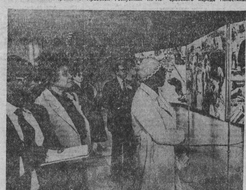
НЬЮ-ЙОРК. «Варварская резня в Бейруте, Ливан, 16—18 сентября 1982 года» — так называется фотосъемка, открытая в штабквартире ООН. Она была организована по решению Генеральной Ассамблеи ООН. Фотографии были сделаны сотрудниками ближневосточного агентства ООН, которые в числе пер-

Зубри резко осудил бесчинства израильских оккупантов в Ливане. Он подчеркнул, что израильские войска прельщаются законом ливанскому правительству распространить свою власть на всю территорию страны. М. Аз-Зубри отметил, что Сирия всегда оказывала и будет оказывать поддержку Организации освобождения Палестины, которая является единственным законным представителем арабского народа Палестины.