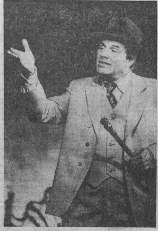
Премьера ПЛУТНИ ПАНАГАТТО