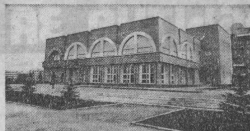
Н ЕДВАЖНО в Новокузнецке открылся специализированный пивной бар «Таежный».

НА СНИМКАХ: пивной бар «Таежный»; в цехе приготовления холодных закусок; в большом зале бара.