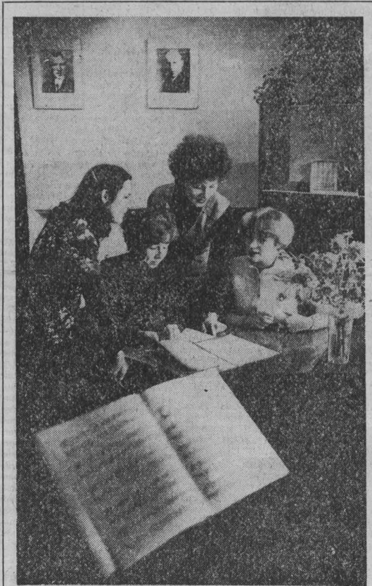
ВЫПУСКНИКОВ Кемеровского культурно-просветительного училища можно встретить в любом уголке нашей области...