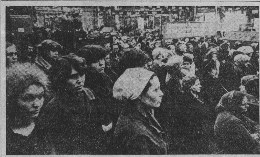
МИНУТА МОЛЧАНИЯ.

В эти скорбные для страны дни в связи с кончиной Леонида Ильича Брежнева партийные, советские, профсоюзные, комсомольские и хозяйственные органы, коллективы трудящихся Кузбасса направили в адрес Центрального Комитета КПСС телеграммы соболезнования. В них они заверяют о своей безграничной верности ленинским идеалам, делом и полностью поддерживают внутреннюю и внешнюю политику ЦК КПСС и Советского правительства, заявляют о горячем стремлении еще теснее сплотиться вокруг родной партии и ее руководящего ядра — ЦК и Политбюро.