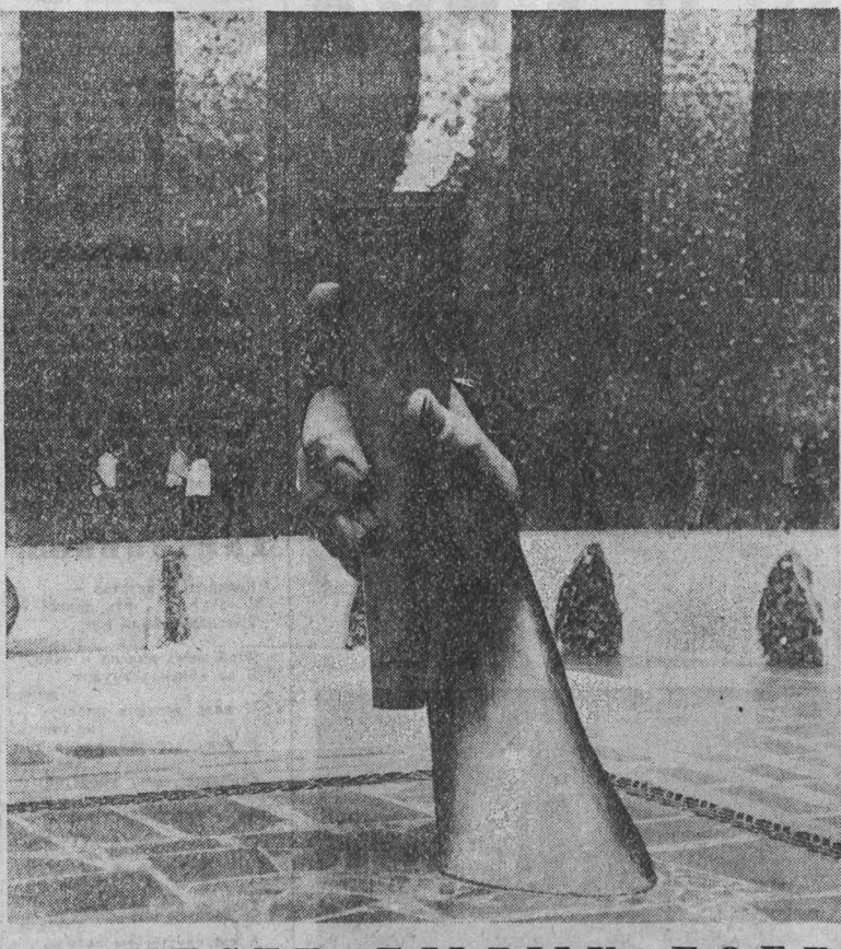
НА МЕСТЕ БЫЛЫХ БОЕВ

Таким образом, по военноположительному и стратегическому результату, количеству участвующих войск, пространственному размаху, степени ожесточенности болей битва на Волге намного превосходит сражения 1942 года в Африке и на Тихом океане. Победа под Сталинградом — крупнейшее военно-политическое событие в ходе борьбы народов мира против германского фашизма.