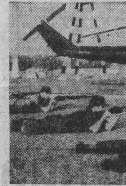
Соединенные Штаты расширяют эскалацию вооруженного вмешательства во внутренние дела Сальвадора...