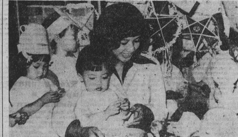
СРВ. Даже в самое суровое время Коммунистическая партия и правительство Вьетнама одной из своих главных задач считали заботу о подрастающем поколении. Бесплатное школьное обучение, широко разветвленная по всей стране сеть дошкольных и медицинских детских учреждений, многочисленные детские клубы, дома культуры, кинотеатры стали неотъемлемой чертой жизни республики.

Юбилейный автобус БУДАПЕШТ, 3. (ТАСС). Юбилейный 50-тысячный автобус «Икарус-200» сошел с конвейера завода в венгерском городе Сечешфехерваре. Эта модель с широкими панорамными стеклами, удобным и вместительным салоном хорошо известна во многих странах, и в первую очередь в Советском Союзе, где в настоящее время эксплуатируется более 30 тысяч таких машин. Специалисты передового предприятия республики про-