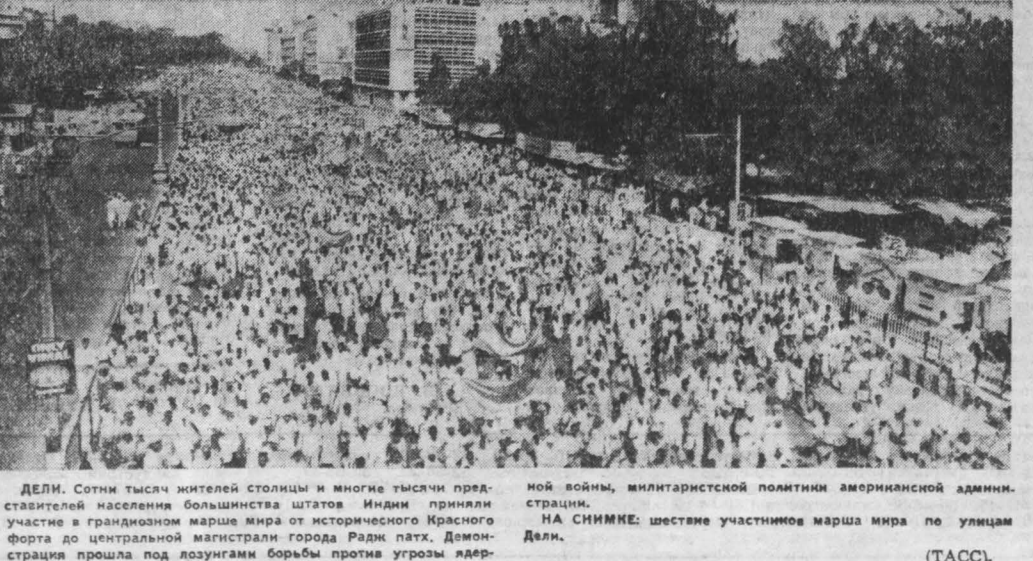
ДЕЛИ. Сотни тысяч жителей столицы и многие тысячи представителей населения большинства штатов Индии приняли участие в грандиозном марше мира от исторического Красного форта до центральной магистрали города Радж пади. Демонстрация прошла под лозунгами борьбы против угрозы ядерной войны, милитаристской политики американской администрации. НА СНИМКЕ: шествие участников марша мира по улицам Дели.