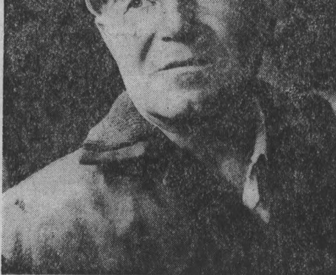
И. КИПРИЯНОВ.