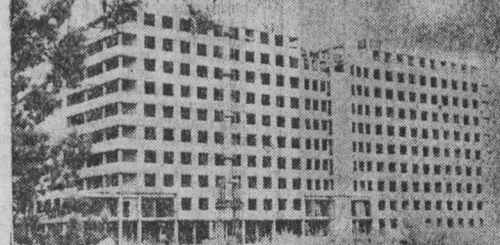
КОЛЛЕКТИВЫ трестов «Кемерово-Гражданстрой» и «Кемерово-Ремстрой» отметили свои юбилей — 25-летие со дня образования. За четверть века строителями построены сотни различных объектов. Это корпуса заводов и фабрик, объекты соцкультбыта, жилые дома и другие объекты.