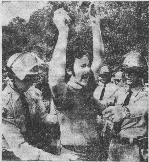
НА СНИМКЕ: полицейские аресты во время демонстрации протеста жителей штата Северная Каролина против загрязнения местности отходами химического производства.