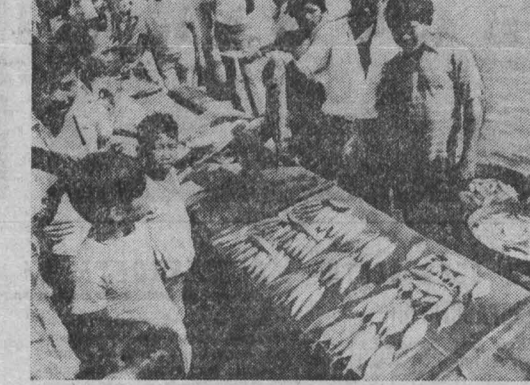
Почти каждый житель филиппинского острова Миндао занимается рыболовством. Рыба является одним из важнейших продуктов питания островитян.

Вашингтон и слышать не хочет о том, чтобы положить конец зависимости Пуэрто-Рико. Совсем наоборот. С помощью пуэрториканской компарторской буржуазии он упорно ведет дело к тому, чтобы полностью аннексировать остров.