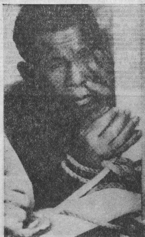
Израильские агенты и шпионы в Бейруте.

ных. Охрана лагеря расстреляла участников этого выступления с караульных вышек, ранив свыше десяти человек. ВАШИНГТОН, 30. (ТАСС). Выступая на состоявшейся здесь пресс-конференции, президент США Рейган вновь заявил в неограниченной поддержке своего стратегического союзника — Израиля. Он подчеркнул, что в основе мирного урегулирования на Ближнем Востоке должна лежать «безопасность» Израиля, не упоминая при этом ни словом о безопасности его арабских соседей. Как здесь стало известно, подготовка израильского вторжения в Ливан и столицу страны — Бейрут осуществлялась в течение длительного времени. Во время маршала ливанской столицы задолго до агрессии Тель-Авива были выведены израильские агенты и шпионы, действовавшие в городе под видом торговцев, служащих, представителей деловых кругов и т. д. Поддерживая в третьих странах регулярные контакты с израильскими спецслужбами, они активно занимались шпионской деятельностью, направленной против Палестинского движения сопротивления и ливанских национально-патристических сил. После вторжения израильтяне в Бейрут многие из этих шпионов появились на улицах города в форме офицеров израильской армии.