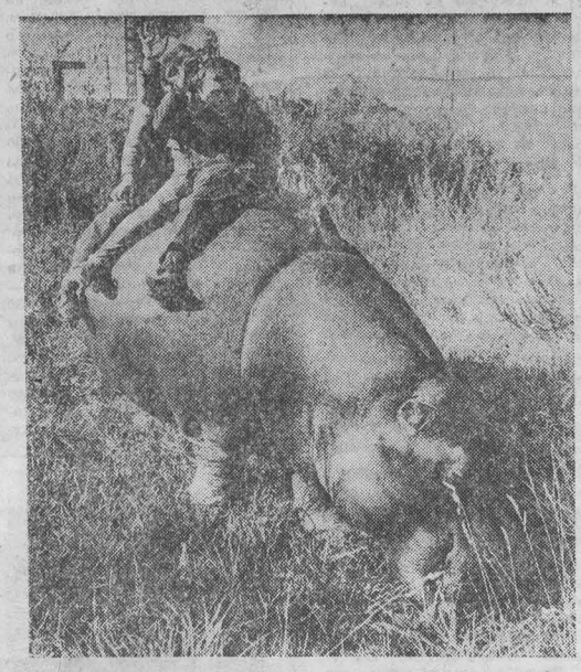
ГОД НАЗАД наша газета рассказывала о необычном купальщике, избравшем вместо городского пляжа толпкие берега Искитими. Так и прославился бегемот Рубин из Московского передвижного зоопарка. Прошел год, и Рубин — снова наш гость.

Теперь по утрам он свободно пашется на пустыре рядом с зоопарком. Видимо, ему очень нравится хрустящая, прихваченная утренними октябрьскими заморозками трава. И как говорят служители зоопарка, пристрастие к вольным прогулкам возникло у Рубина только в Кемерове: видимо, сказывается близость реки, чем-то напоминающей ему о родине... НА СНИМКЕ: бегемот Рубин на очередной прогулке.