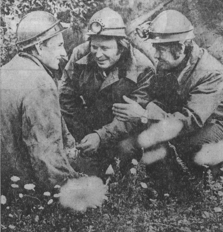
М ЕСТЬ о чем поговорить, что вспомнить. Все трое работают на шахте «Таштагол»...