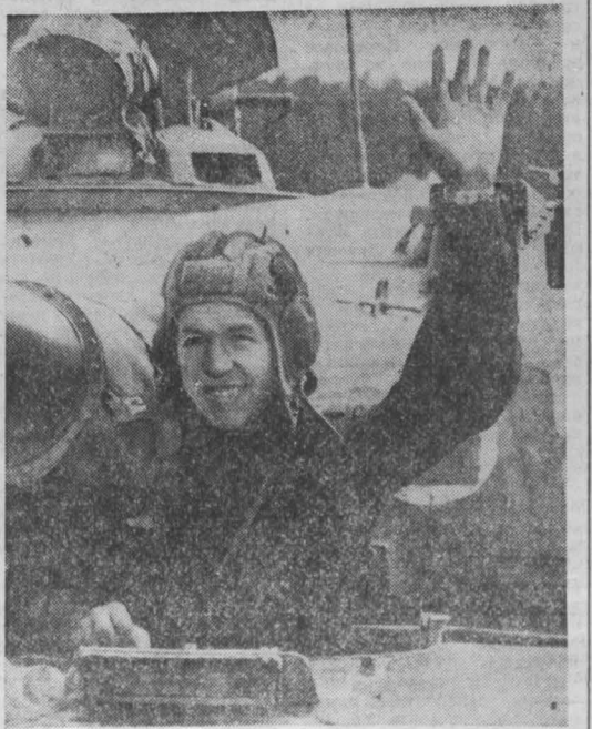
КРАСНОЗНАМЕННЫЙ ПРИКАРПАТСКИЙ ВОЕННЫЙ ОКРУГ. Отличными успехами в боевой и политической подготовке встречают свой праздник танкисты прославленной мотострелковой Самаро-Ульяновской Бердичевской Железной дивизии.