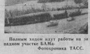
Полным ходом идут работы на заднем участке БАМа. Фотохроника ТАСС.