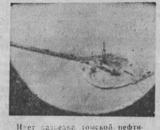
Идет разведка томской нефти.