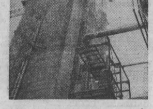
Сооружение производства карбонида в кемеровском производственном объединении «Азот».