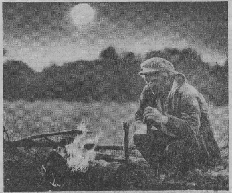
УТРО НА РЕЧКЕ.

Интересно и с пользой проводит свой досуг обитатели молодежного общежития производственного объединения «Кузбассэлектромотор», которое расположено на бульваре Строителей. Многолюдно в красном уголке, Ленинской и учебной комнатах, в игровом. Совет общежития вместе с организаторами воспитательной работы налаживает тесное сотрудничество с членами лекторской группы общества «Знание», клубными и библиотечными работниками. Перед молодыми рабочими выступают лекторы-международники, врачи, ученые. Здесь частые гости уважаемые люди города, ветераны войны и труда. Содержательная работа и клубов по интересам. К примеру, каждый третий вторник в клубе «Спутник» встречи с сотрудниками милиции, беседы на правовые темы. В клубе «Лакомка» девушки узнают секреты кулинарии, учаща сервировать стол, что немаловажно для будущей хозяйки. Любители посплетничать собираются в клубе «Киты» («Кино и ты»). Здесь традиционными стали дискуссии, обсуждения новых кинолент. Ю. СТАРШИНОВ.