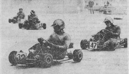
НА СНИМКАХ: один из заездов картингистов в классе «Союз» (юниоры).

Интервью взял В. МИХАЙЛОВ, г. Прокопьевск.