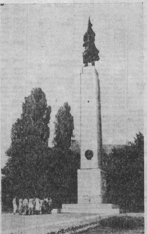
БУХАРЕСТ. Памятник советскому солдату-освободителю на площади Победы. Он воздвигнут в честь воинов Советской Армии, погибших на территории Румынии в боях за ее освобождение от гитлеровского рабства.

БЕИРУТ, 27 августа. (ТАСС). Продолжается начавшаяся пять дней назад эвакуация палестинцев из Западного Бейрута. 25 августа две очередные группы палестинских бойцов покинули ливанскую столицу. Первая из них в составе 560 человек прибыла вчера в сирийский порт Тартус, другая направляется в Судан. Первоначально предполагалось, что эвакуация палестинцев в Сирию будет проходить по шоссе на дороге Бейрут — Дамаск. Согласно разработанному плану, израильские войска должны были отойти на шесть километров от этой магистрали в тех районах, где она находится под их контролем. Однако к намеченному сроку это условие так и не было выполнено Израилем, преднамеренно нарушившим достигнутую ранее договоренность. Президент Рейган официально уведомил конгресс США о высадке в Ливане американского отряда, входящего в состав сил разведения. Он указал, что американские войска будут находиться в Бейруте «на ограниченной и временной основе», вводятся в страну на срок не более 30 дней и не будут принимать участия в военных операциях. Все новые данные свидетельствуют о том, что оккупация Израилем большей части ливанской территории приобретает затяжной характер. Радио Израиля без обиняков заявило, что интервенционистские силы готовятся провести на захваченных землях предстоящую зиму.