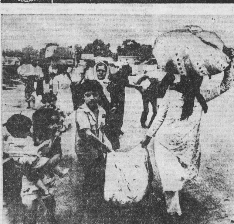
ДЕСЯТКИ тысяч убитых и раненых ливанцев и палестинцев, тысячи пропавших без вести, один миллион лишившихся крова — таков итог варварской израильской агрессии против Ливана. НА СНИМКЕ: ливанские беженцы.