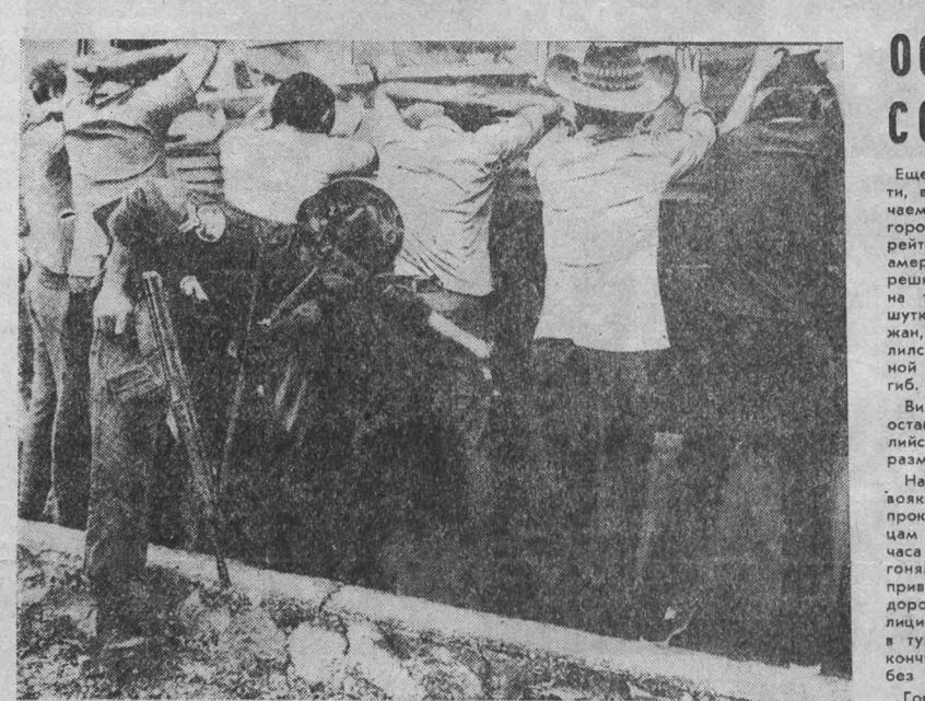
США намерены и впредь оказывать массовую военную помощь марionеточному режиму в Сальвадоре, ведущему войну на уничтожение против своего народа. Сожженные дотла деревни, массовые расправы над крестьянами, в ходе которых головорезы не щадят ни женщин, ни детей, ни стариков, — эти страшные злодеяния чинят в Сальвадоре обученные в Соединенных Штатах, оснащенные американским оружием солдаты, те, кого ныне в Вашингтоне пытаются представить в облике «защитников свободы и демократии». НА СНИМКЕ: обыск пассажиров автобуса. (Фотохроника ТАСС).

Протест МИД Никарагуа МАНАГУА, 20 августа. (ТАСС). Министерство иностранных дел Никарагуа выразило решительный протест против новой грубой провокации, которую совершили против революционной республики Соединенные Штаты. Как сообщается в распространенном здесь заявлении МИД, 17 августа американский эсминец «Спрингс» вторгся в территориальные воды Никарагуа и приблизился на расстояние 10 миль к ее берегам. Военный корабль Соединенных Штатов, говорится в документе, оснащен современным оборудованием для ведения шлюножания, а также различным вооружением, в том числе ракетами, торпедами и вертолетами. Присутствие американского эсминца в территориаль-