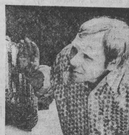
г. Березовский.