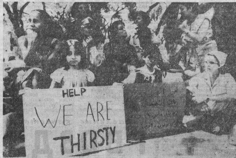
ОБСТАНОВКА в ливанской столице... НА СНИМКЕ: «Помогите, мы хотим пить» — написано на плакате этой ливанской девочки.