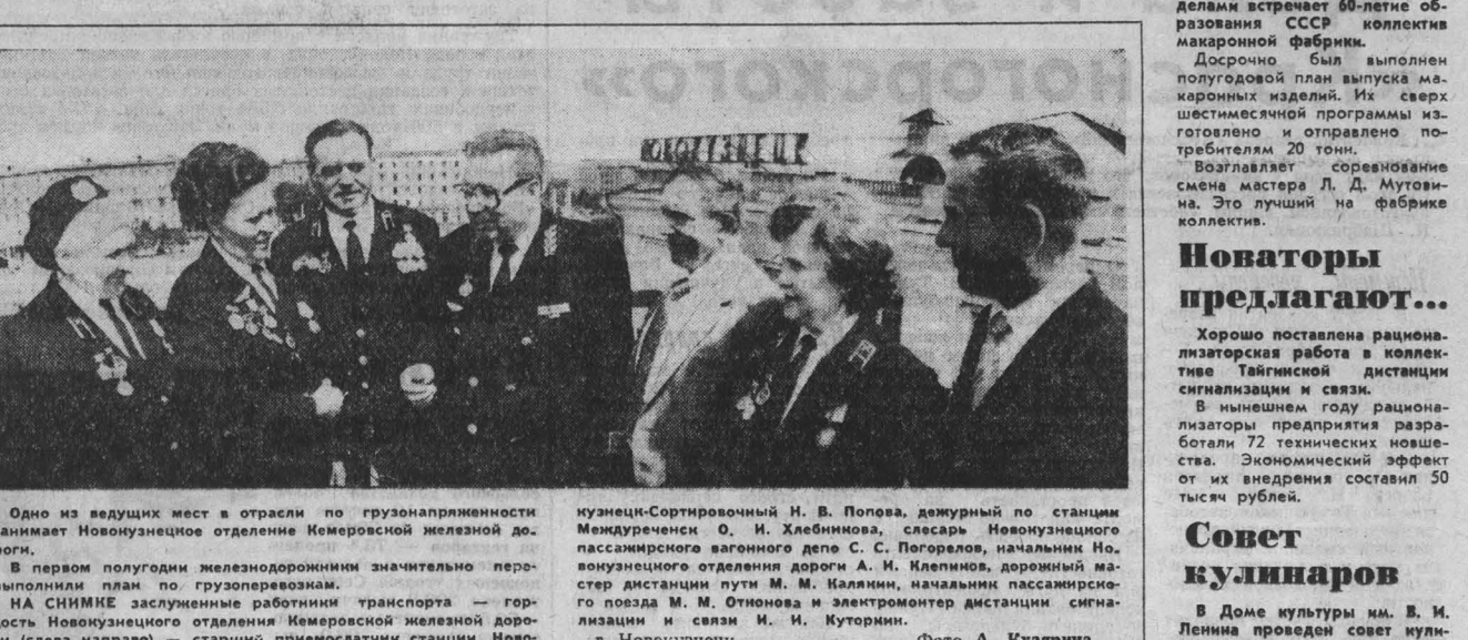
Одно из ведущих мест в отрасли по грузонапряженности занимает Новокузнецкое отделение Кемеровской железной дороги. В первом полугодии железнодорожники значительно перевыполнили план по грузоперевозкам. НА СНИМKE заслуженные работники транспорта — гордость Новокузнецкого отделения Кемеровской железной дороги (слева направо) — старший приемосдатчик станции Новокузнецк.