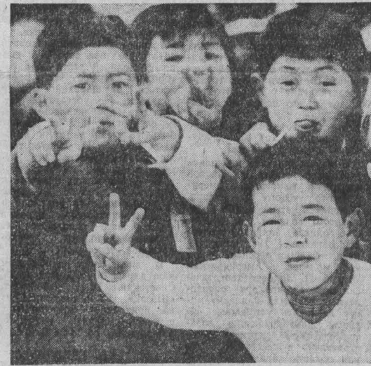
ЯПОНИЯ, ставшая жертвой атомной бомбардировки, до сих пор ощущает последствия этой варварской акта США. Население страны активно выступает за ядерное разоружение, за мирное сосуществование между народами. НА СНИМКАХ: дети Японии — за мир; эпицентр взрыва атомной бомбы в Нагасаки.

БЕЛГРАД. По сообщению агентства ТАНОЮ, иракской комитет Союза коммунистов Югославии обсудил задачи по стабилизации политического положения в Ираке. Национальная роль между албанским населением и проживающими здесь сербами и черногорцами продолжает проявляться в острейших формах. В последние дни в некоторых населенных пунктах состоялась демонстрация, участники которой требовали провозглашения Югославии республики; имели место случаи саботажа и диверсий на предприятиях. Член президиума иракского комитета С. Долошевич сообщил на пленуме, что органами безопасности раскрыты 4 подпольные организации и 55 групп; более 500 человек находятся под следствием. (ТАСС, 4 августа).