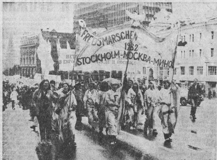
МОСКВА. Учасники «Марша мира-82» на главной магистрали советской столицы — улице Горького.