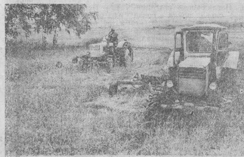
В сложных условиях приходится вести вынужденную заготовку кормов колхозу «Победа» — самокормящие угодья попали под сильнейшую засуху. Но труженики хозяйства, население села Красного делают все возможное, чтобы создать надежный запас кормов для общественного животноводства. Самоотверженный труд людей позволил взять в неудобных сотнях тонн сена, произвести 400 тонн витаминных гранул из трав.