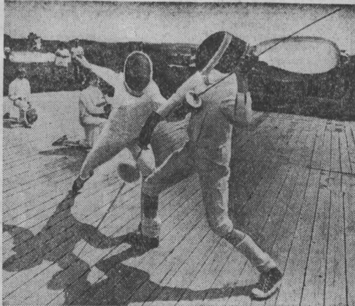
г. Кемерово.

Лето в самом разгаре. На турбазе производственного объединения «Азот» отдыхают сотни трудящихся предприятий, инженерно-технические работники, спортсмены. Особенно многолюдно здесь в выходные дни. К услугам отдыхающих спортивные площадки, пляж на берегу Томи, прогулочные лодки. НА СНИМКАХ: парад юных спортсменов; турнир фехтовальщиков; приятно, весело отдыхать всей семьей.