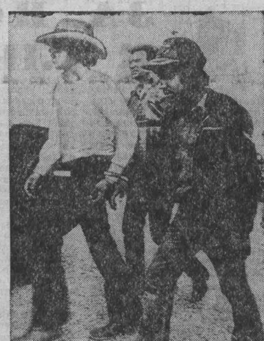
НА СНИМКЕ: во время облавы на иностранных рабочих в штате Колорадо.

В Соединенных Штатах прошли массовые облавы на иностранных рабочих, в ходе которых были арестованы свыше 6 тысяч человек. Это «батальон» калифорнийских, техасских, орегонских и каролинских плантаций, цехов потогонных мастеров Лос-Анжелеса и Нью-Йорка, другие представители самой бесправной категории трудящихся в США. Этих выходцев из стран Азии и Латинской Америки, называемых «незаконными иммигрантами», насчитывается по данным газеты «Сан-Франциско хроникл», до 8 миллионов человек. В США их заманили обещанием заработка и заставляли за гроши гнуть спину. Большой бизнес заинтересован в подобной армии рабочей силы. Как указывает журнал «Инкуайерер», «незаконные иностранцы» являются объектом чудовищной эксплуатации со стороны бесовитых предпринимателей, которые в любой момент могут вышвырнуть их из страны.