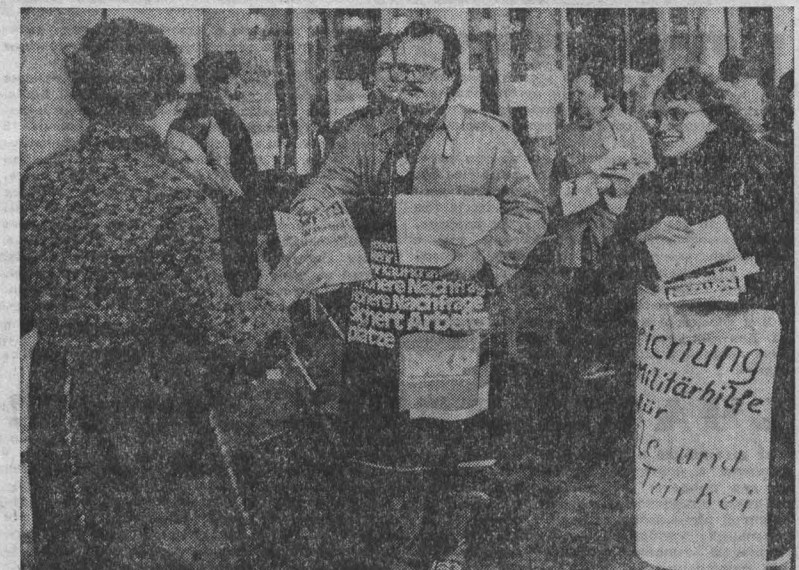
Упорную и мужественную борьбу за разрядку и взаимопонимание между народами, за социальные права и демократические свободы трудящихся ФРГ ведут западногерманские коммунисты. НА СНИМКЕ: активисты Германской коммунистической партии распространяют на улицах рурского города Мюльгайма демократические издания, рассказывающие о положении в мире, о наступлении западногерманских монополий на права рабочего класса.

пространение антисоциалистической литературы и создание на территории Польши собственной радиостанции. Эти подрывные планы осуществлялись при финансовой и технической поддержке Запада. В настоящее время, указывает «Трибуна людей», антисоциалистические элементы в Польше активно выступают на страницах западной печати с подстрекательскими заявлениями. Так, например, один из лидеров «Солидарности» Збигнев Ромашевский недавно открыто призвал к проведению антигосударственных выступлений и созданию контрреволюционного подполья. Ромашевский и его приспешники, подчеркивает «Трибуна людей», — это типичный пример тех деятелей, которые стремятся к достижению своих антисоциалистических целей.