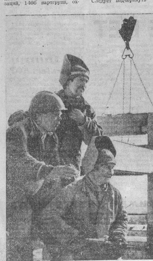
Новости События Факты