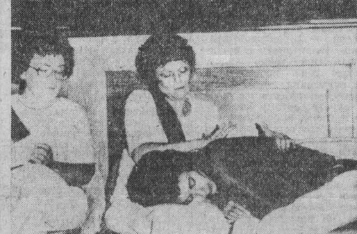
США. В знак протеста против существующей в стране жесткой дискриминации женщин во всех сферах жизни...