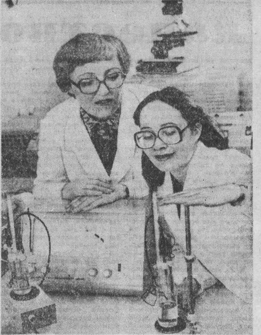
КОНТРОЛЬНО-АНАЛИТИЧЕСКАЯ лаборатория Кемеровского алтечного управления размещалась в новом помещении полгода назад. Современные приборы позволяют сотрудникам с высокой точностью определять химический и бактериологический составы различных лекарств.

Продолжение. Начало в номере за 30 июня.