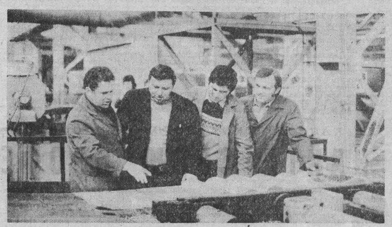
БОЛГАРИЯ. Недавно завершилось строительство Шуменского комбината по обработке алюминия.