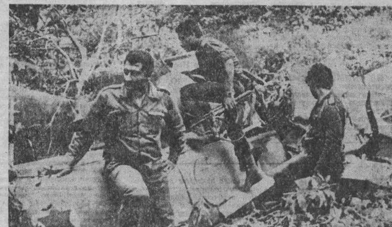
Ливан. Израильский военный вертолет, участвовавший в высадке десанта на территории Ливана. НА СНИМКЕ: останки воздушного шара.