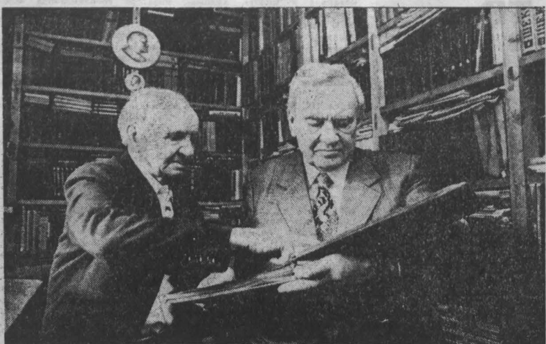
МАЛЫЙ ТЕАТР СССР

На центральной площади Ленинска-Кузнецкого выехала «Волга» с эмблемой Малого театра на ветровом стекле. Прохожие, зная из газет, что в областном центре проходит гастроли этого столичного театрального коллектива, с удовольствием смотрели след машины, завернувшей во двор одного из домов по проспекту Кирова — вроде бы не спектакль, ни встреч с мастерами Малого в их городе не предполагалось.