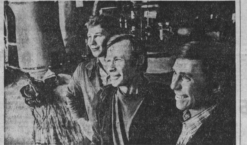
ЭКОНОМИКА ДОЛЖНА БЫТЬ ЭКОНОМНОЙ А. И. БРЕЖНЕВ

Бригада обслуживает семь реакторов, кроме того, «на боковой ветке стоит целый состав построенных «сталеваров»: вагоны: 100-тонные углевозы, предназначенные для эксплуатации на железных дорогах Польши, 64-тонные крытые грузовые вагоны и 105-тонные думпкары — вагоны, автоматически разгружающиеся на две стороны. Я