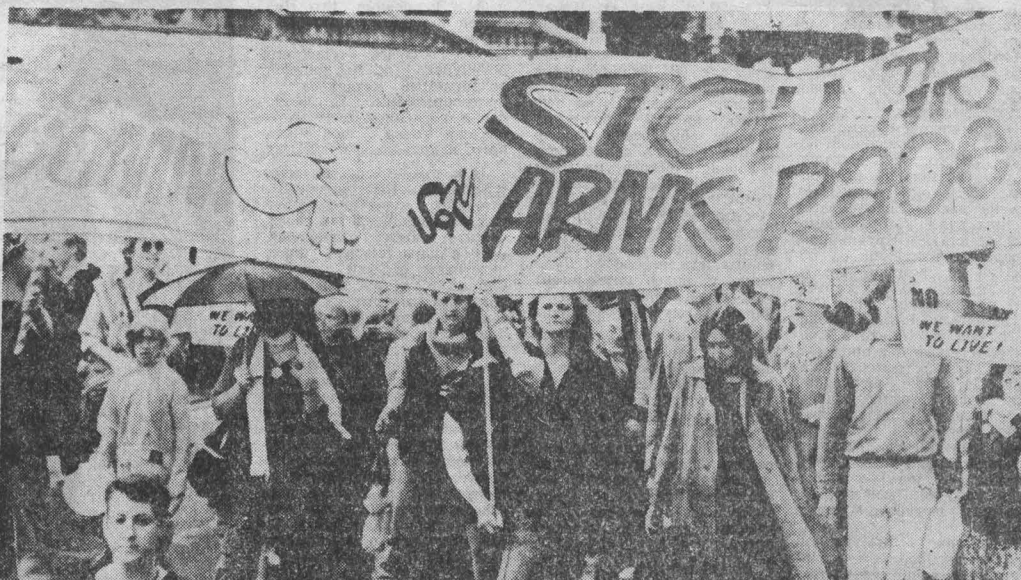
МИЛЛИОНЫ жителей Австралии выступают за успешное проведение второй специальной сессии Генеральной Ассамблеи ООН по разоружению. По всей стране проходят массовые демонстрации и митинги в поддержку развития движения за мир, против опасности новой войны. Участники манифестаций призвали к развертыванию широкой кампании за ликвидацию американских баз на австралийском континенте, превращение Индийского океана в зону мира, а также потребовали от правительства Фрейзера проводить на международной арене политику не присоединения и выйти из военного блока АНЗЮС, вовлекающего страну в орбиту американской глобальной стратегии.

С ответным словом выступил Председатель Совета Министров ГДР В. Штоф. На этом XXXVI заседании сессии СЗВ закончили работу.