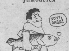
Рис. А. Алешиничев. г. Москва.