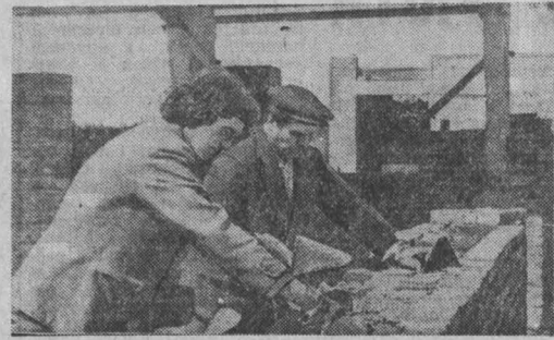
Продовольственная программа: сельский цех шахты

7652 — столько писем получила редакция за пять месяцев этого года. Из них опубликовано 1936. Поступило 1782 ответа о принятых мерах по неопубликованным жалобам. Наибольшее количество писем получено по следующим проблемам: торговли — 262, жилищной — 211, бытового обслуживания — 196, водоснабжения — 146, связи — 177, здравоохранения — 104, благоустройства — 110. Из Кемерово пришло 4837 писем, из Новокузнецка — 337, из Белова — 205, Ленинска-Кузнецкого — 175, Прокопьевска — 143, Березовского — 116. Читатели Кемеровского района прислали 126 писем, Промышленновского — 88, Беловского — 75, Яшиновского — 56, Крайновского — 51.