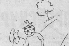
Рис. А. Алешиничев. г. Москва.