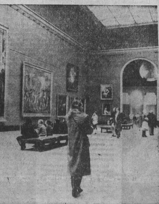
МА СНИМКИ: в зале музея.