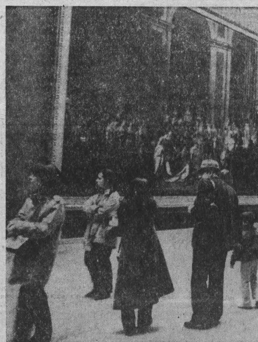
Лувр — крупнейший национальный музей Франции, где собрана большая коллекция произведений древнеегипетского, античного, западноевропейского искусства.