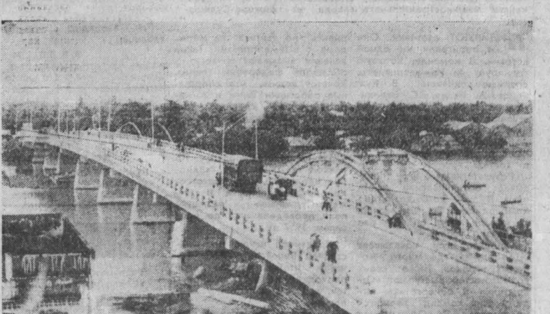
СРВ. В провинции Хуэйлинг через реку Хуэйлинг построен новый мост (на снимке). Его длина 223 метра, ширина 11 метров. Он соединит город Хошминн и провинцию Миньхан.