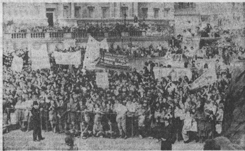
АНГЛИЯ. Растущее вмешательство США в дела Сальвадора и других стран...