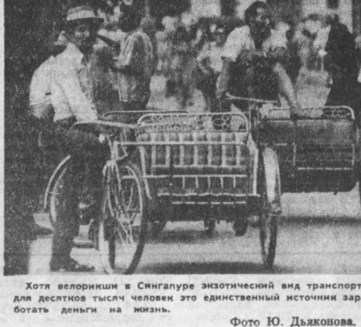
Хотя велорикши в Сингапуре экзотический вид транспорта...