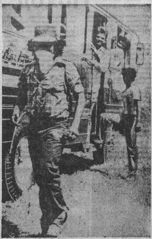
РАДИОСТАНЦИЯ «Венсерос» сообщает о смелых боевых действиях, которые совершают отряды Фронта национального освобождения имени Фарабуно Марти. Используют захваченное у противника оружие, умело применяют тактику партизанской войны, патриоты устраивают засады на маршрутах перемещения войск хунты, берут под свой контроль стратегически важные районы.