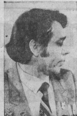
И. ШВЕИТ: «Обязательств не выполняли, но настроены в бригаде боевой».