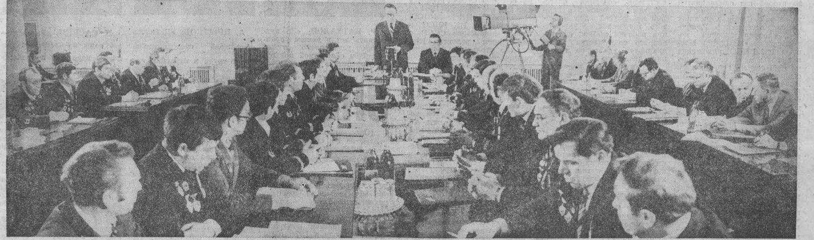
НА СПИЛКЕ: на встрече руководителей передовых бригад угольной промышленности области.

Бюро обкома КПСС приняло постановление о социалистических обязательствах передовых бригад предприятий угольной промышленности Кузбасса на 1982 год.