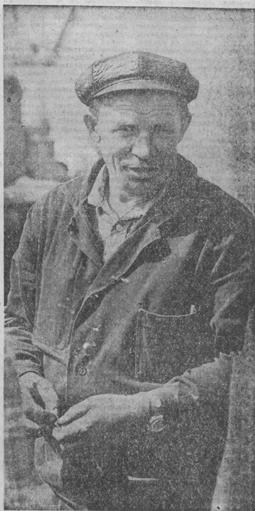
редственно, как овощеводы, картофелеводы, заинтересовано и звено Гулевича. Полив здесь тоже за ним, а основная оплата будет произведена в конце полевого сезона за конечный результат — урожайность, выполнение установленных заданий.

В получении высокого урожая этих культур непос-