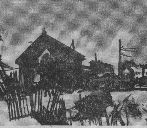
В. А. Селиванов. «Первый снег»